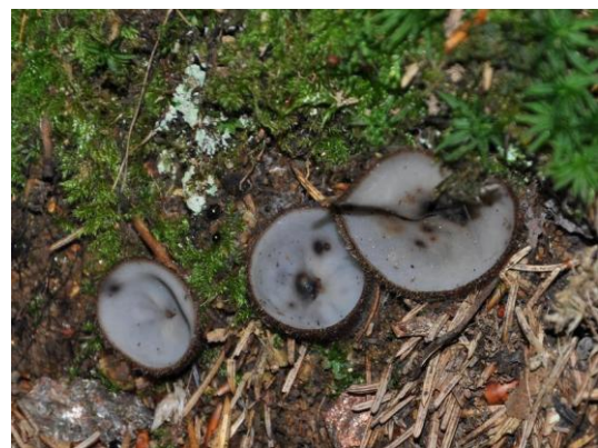
Rejštejn - bělokosmatka polokulovitá

se vyskytuje olše šedá. Samotný Pěkný potok je bez šnečí fauny. Zastoupení jsou v čisté, průhledné vodě chrostíci. Mírně dramatický tok zmiňovaného potoka některé z nás svedl k fotografování. Cestou jsme míjeli opuštěné další stavení s drobným pomníčkem, tentokrát vytvořeným z části řezačky na slámu. Vlastně celou cestu jsme mohli v lese pozorovat kamenné zídky a snosy z kopců, které předělovaly les. A to jsme již stanuli nedaleko malého vodopádu pod zbytky starého mlýna. Při jeho focení jsem narazil na skupinu skokanů hnědých ( Rana temporaria ), kteří vyrušení poskakovali mezi listím a spadlými