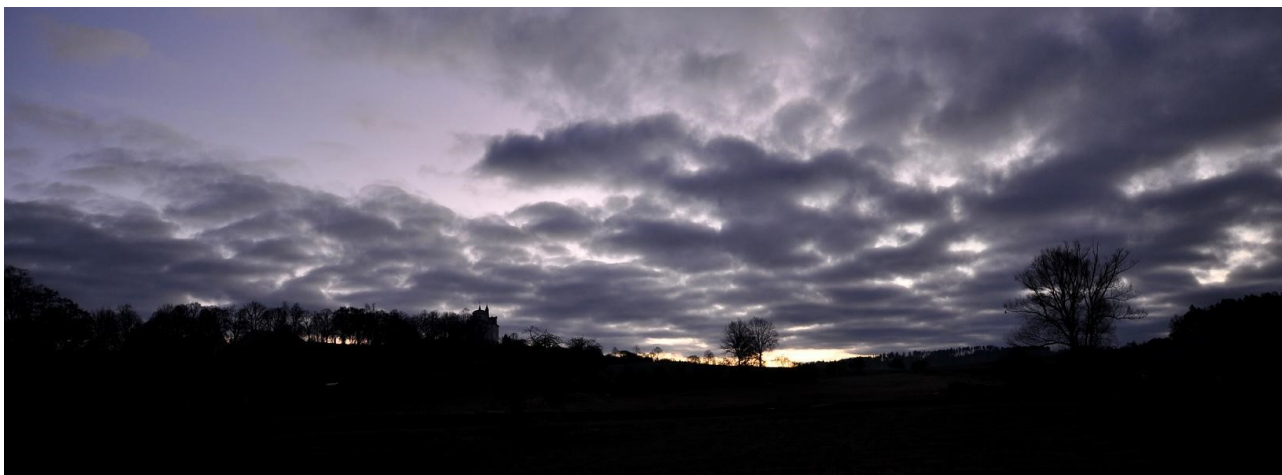
Slunce vychází, den se probouzí.

Těším se do krajiny. Ráno jsem se probudil, pohlédl na oblohu - a hled'me! Pocuchané beránky mraků mají mezery a mezi nimi mrkají hvězdy. O to lépe vstát a vydat se na snad užitečnou procházku za počítáním ptačích dravců. Trasa obvyklá. Strakonice – Radomyšl a zpět pěšky. Oficiálně označeno jako akce Buteo.