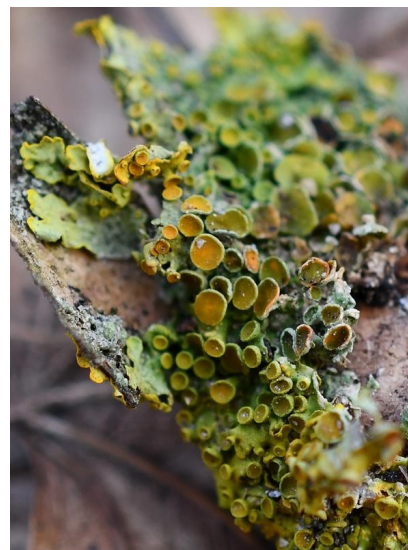
Cestou prostřední Terčovník zední

U židovského hřbitova jsem krátce spatřil kousek srnčího, jak mně mává zrcátkem. Lepší bylo seskupení lišejníků a mechů. Jen to pořádné světlo chybělo.