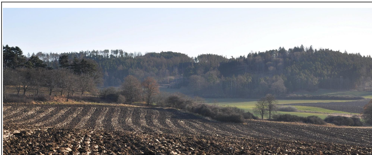
Pole orané s Chlumem v pozadí

Vstávalo se ráno do tmy. Hvězdy na obloze si pohrávaly a skoro do poslední chvíle nebylo známo, jak se počasí 14. ledna 2023 projeví. Studený vítr byl nepříjemný. Asi to vadilo i ptactvu, které bylo rozmístěno v krajině cestou k radomyšlskému hřbitovu.