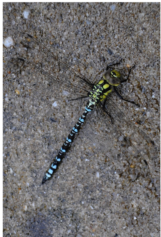
Šídlo modré ( Aeshna cyanea )

Sestup je chvílemi okořeněn skalnatými schody, větvemi a jinými překážkami. Míjíme drobný skalní převis. V suchém prachu se mně zdá, že vidím obrys větších tlap. Kousek dál narazíme na trus jelena. V botách máme teď už asi všichni vlhko. Ale nevadí nám. Nakonec se dostaneme na zpevněnou lesní cestu a pokračujeme směrem k zelené značené turistické cestě. Během cesty si všimnu velkého exempláře šídla modrého ( Aeshna cyanea ). Leží na cestě, oslabeno vytrvalým deštěm. Ale to již uháníme dolů, k Volarům. Ještě uskutečním krátkou zastávku u studánky s dřevěným žlábkem a kamenným ostěním. Na mapě není. A pak rychle dolů. Projdeme po Mlýnské ulici u Volar a jsme ve městě. Do odjezdu vlaku nám zbývá pár minut. Setřásáme kapky vody a usmíváme se. Byl to náročný výlet, ale stál za to. Já si cestou promítám v hlavě knihu Horský křišťál od Adalberta Stiftera, jehož rodný dům jsme v Horní Plané míjeli. Je možné, že kdybych se sem dostal za slunečného počasí, nebyl by zážitek z této knihy tak umocněn.