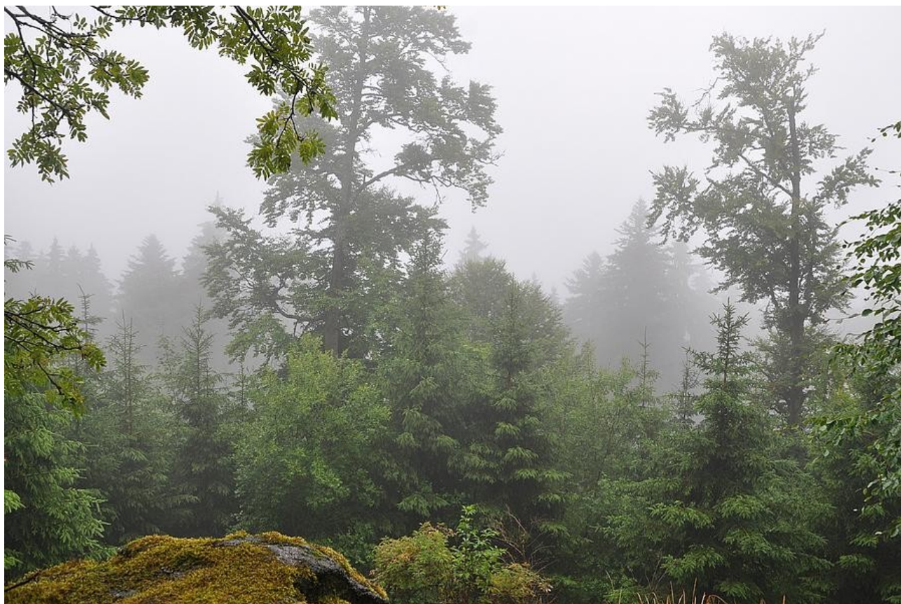
Mechový vrch a pohled do deště