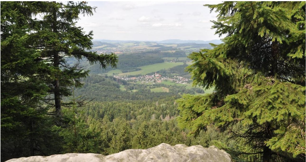
Machov - Bor - Krásná vyhlídka

Rodinný vítr nás zavál do Orlických hor. Jezdíme tam rádi. Na některých místech, kam nevedou sličné cesty, stezky a cyklistické road movie, málokdy potkáte lidského živáčka.